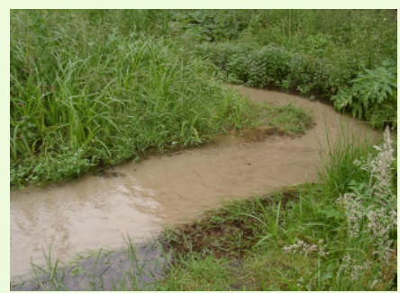
Fotografische Impressionen aus dem Bullerbachtal von Erika Petring

Seit ich meine Voruntersuchungen an Buller- und Sprungbach abgeschlossen habe, bin ich in meinem Bezirk fast ausschließlich mit dem Fahrrad unterwegs. Die Probleme mit illegalen Müllablagerungen, wildem Grillen o. ä. sind in meinem Bezirk zwar auch nicht unbekannt, aber glücklicherweise längst nicht so ausgeprägt, wie es von anderen Landschaftswächtern berichtet wird. Gelegentliche Fälle von Sperrmüllentsorgungen im Bachbett oder Abstellen von unverschlossenen Dieselkanistern an der Böschung, die schnelles Handeln erforderten, wurden nach Meldung bei der zuständigen Behörde zumeist umgehend zur vollsten Zufriedenheit erledigt und der Müll beseitigt. Schlimmeres ist bei mir bislang nicht vorgekommen - und wird es hoffentlich auch in Zukunft nicht.