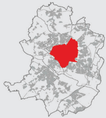
Förderkulisse 1: Stadtbezirk Mitte