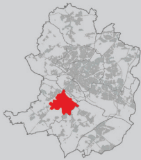
Förderkulisse 2: Stadtbezirk Brackwede (rote Fläche)